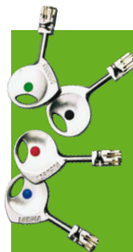
Cylindre 787 Z

Nos produits sont garantis 10 ans. Voir conditions auprès de votre Point Fort Fichet ou sur notre site www.fichet-pointfort.com